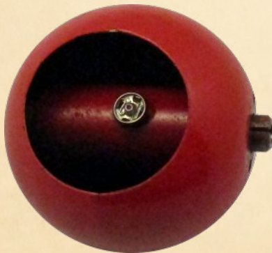
Automatischer Tuchball Durch ein Federwerk im Inneren des Balles wird ein Tuch blitzschnell hineingezogen.