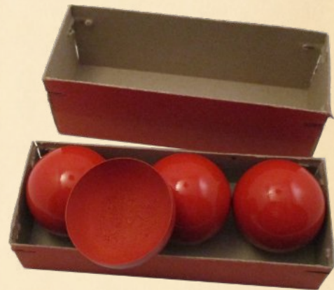
Chikagoer Billardball Trick. Dieser Ballsatz müsste von Zauberkellerhof stammen.